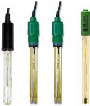
HI1286DGB HI2114P HI3214P HI4430B/3